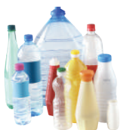
LES FLAONS ET BOUTEILLES PLASTIQUE