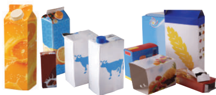
LES EMBALLAGES EN CARTON ET LES BRIQUES ALIMENTAIRES