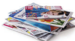
LES REVUES ET PROSPECTUS