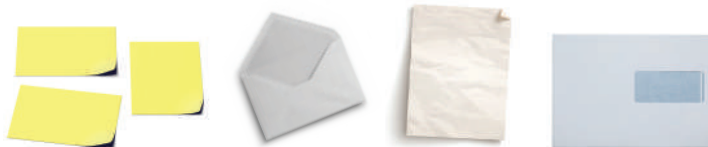
LES PAPIERS ET ENVELOPPES