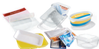
LES BARQUETTES ET BLISTERS