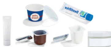
LES POTS ET TUBES