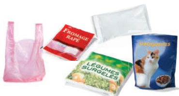
LES SACS ET SACHETS