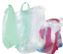
LES FILMS ALIMENTAIRES